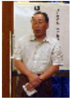
誕生祝:南克昌会員