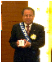
通算11年半:小森会員