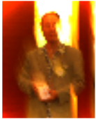
32年:光満会員 連続14年半:吉中会員