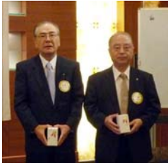
誕生祝い 南会長・矢田会員