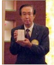
皆勤賞 通算9年:高山会員